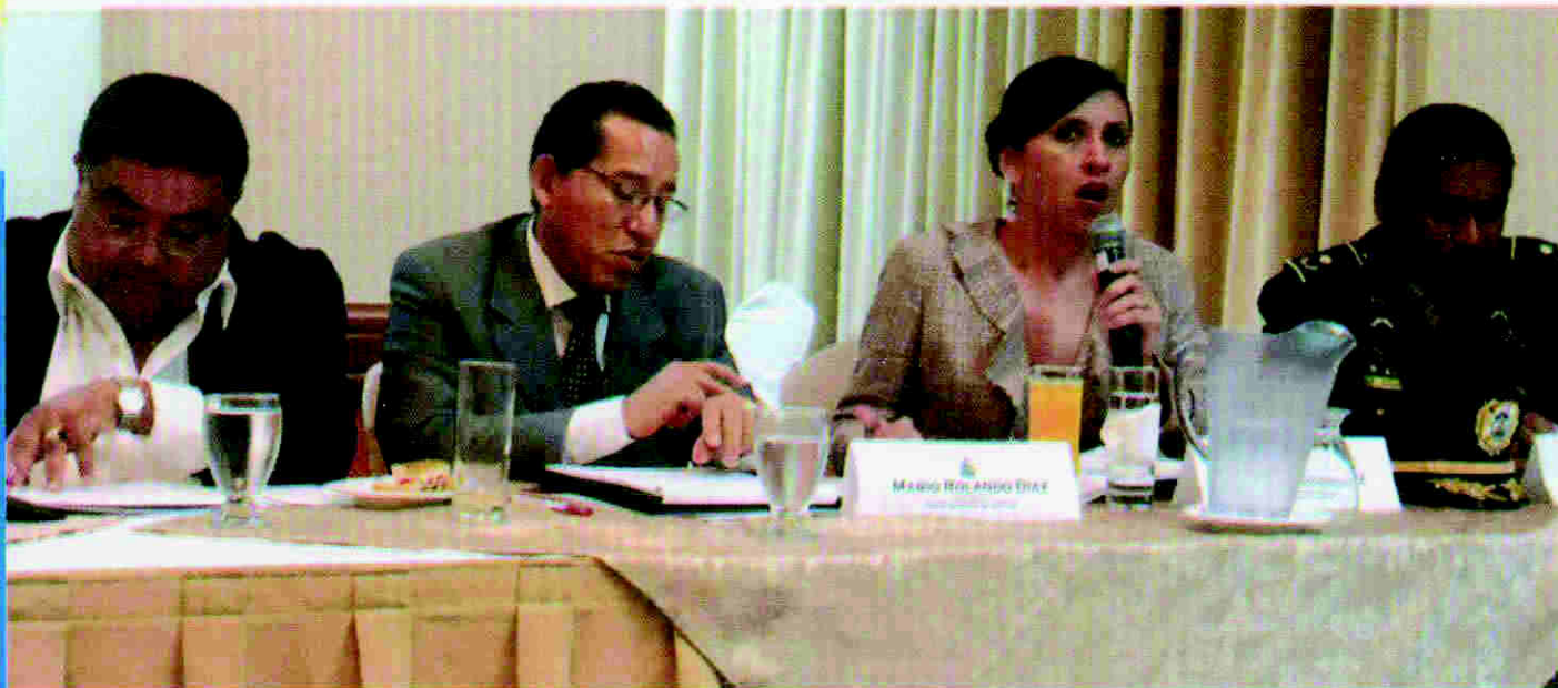
Operadores de Justicia compartieron con la CRSP sus puntos de vista sobre la ubicación, estructura y funcionamiento del órgano de investigación criminal.

Igualmente, la CRSP realizó conversatorios para conocer experiencias de otros países sobre la ubicación, funciones y estructura del órgano de investigación criminal, en los cuales se destacó la importancia de mantener indisoluble la relación de coordinación entre fiscales y policías de investigación, para enfrentar con éxito la lucha contra la impunidad de los hechos delictivos.