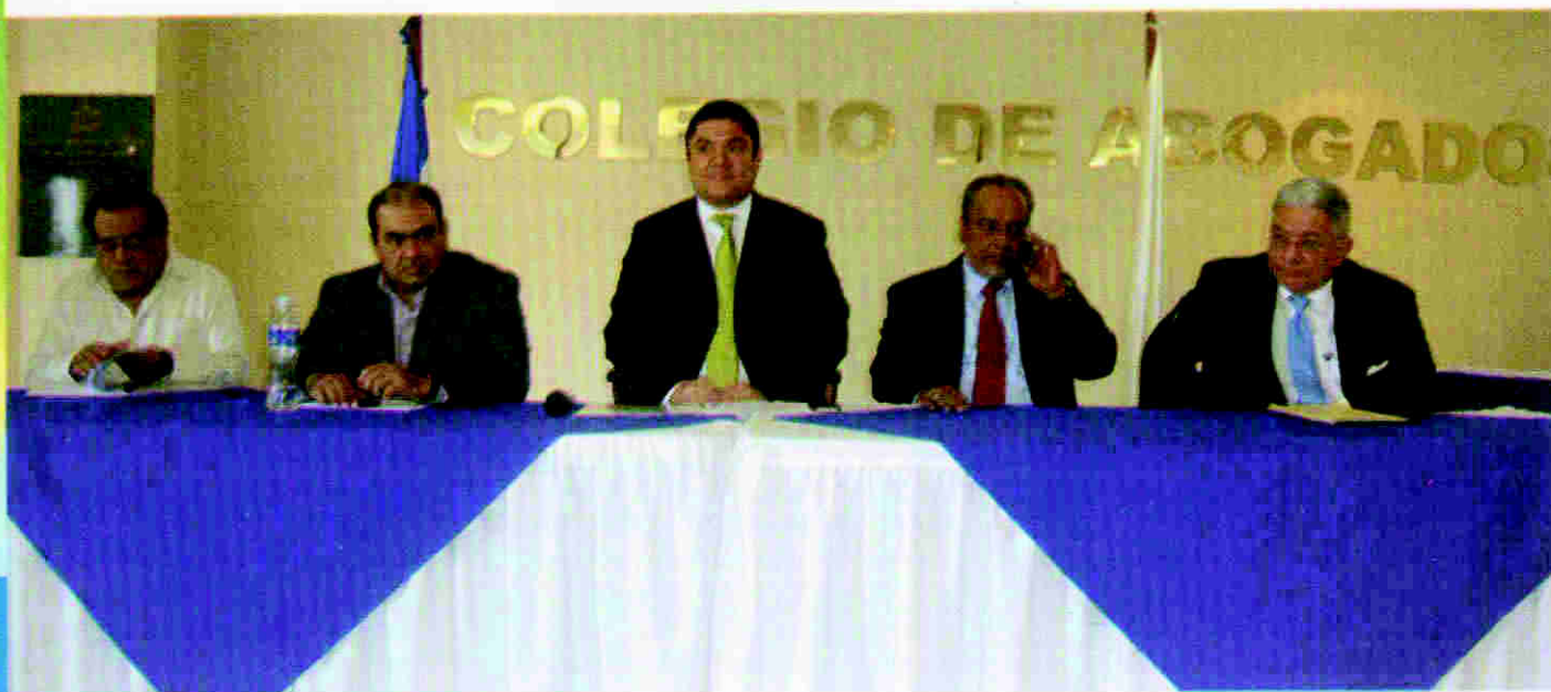
Mesa principal del taller de socialización de las propuestas de reforma realizado en el Colegio de Abogados de Honduras.

El Colegio de Abogados de Honduras impulsó la realización de dos talleres para la socialización del contenido de las primeras propuestas de reforma entregadas por la CRSP al presidente de la República. Las jornadas se desarrollaron para los días 20 y 22 de noviembre en las ciudades de Tegucigalpa y San Pedro Sula respectivamente.