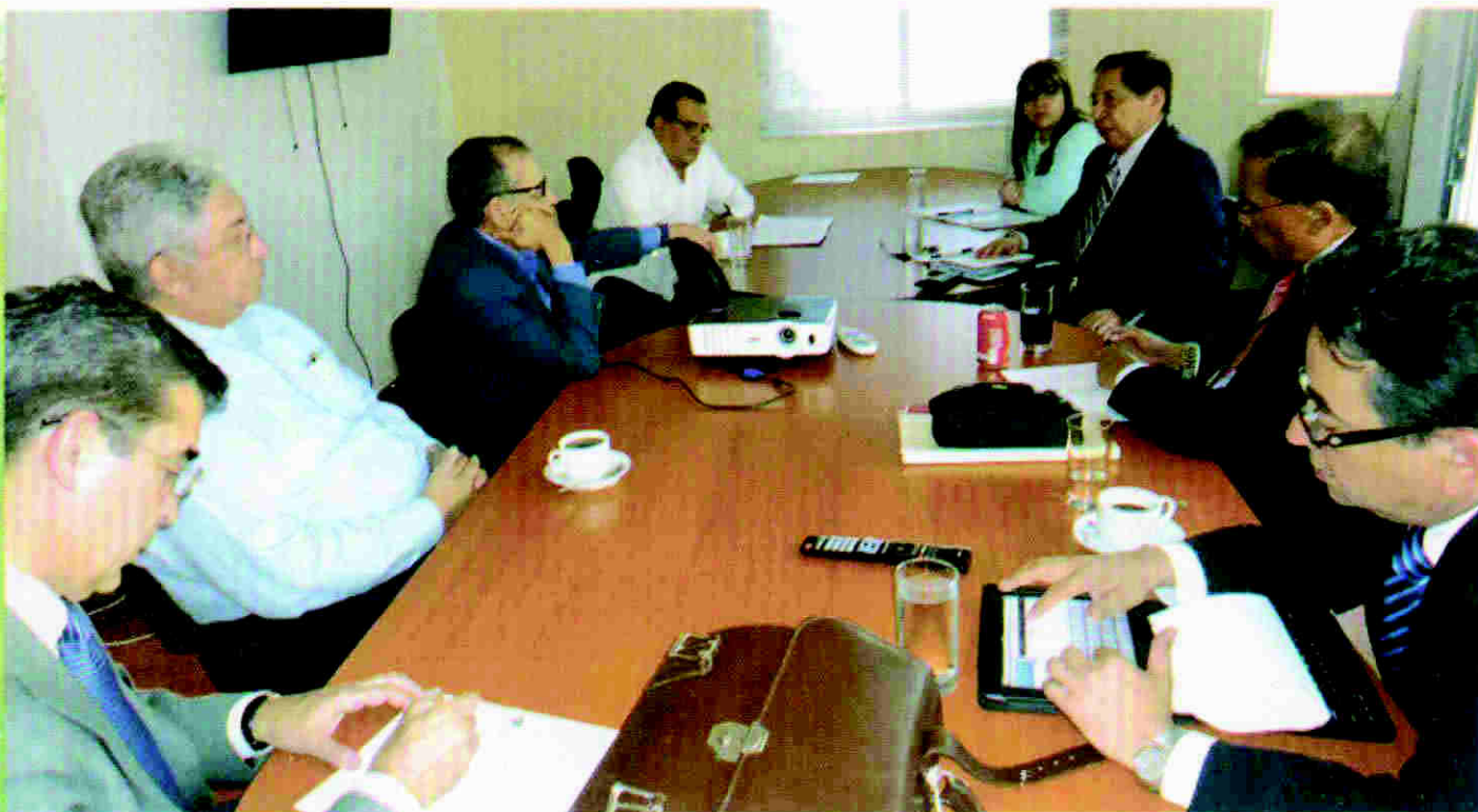
Reunión con miembros del Comité Técnico de Fideicomiso de la Tasa de Seguridad en la CRSP.