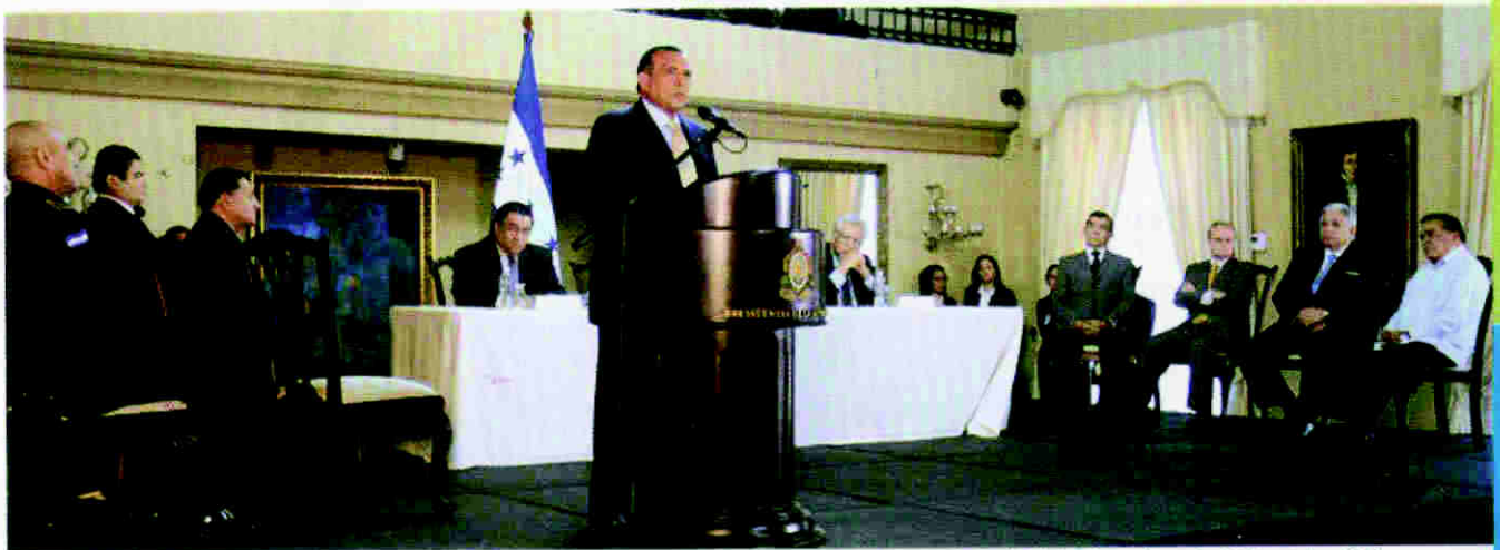
Ceremonia de entrega de las primeras propuestas de la CRSP al Señor Presidente de la República, licenciado Porfirio Lobo Sosa, el pasado 26 de octubre 2012.

El Consejo de la Judicatura y de la Carrera Judicial estará integrado por cinco Consejeros, electos por el Congreso Nacional de la nómina de diez candidatos que remitirá el Sistema de Selección y Evaluación (SSE), seleccionados de los que ocupen los primeros lugares en el concurso. Los miembros del Consejo durarán cinco años en el ejercicio de sus cargos, la presidencia de este órgano será rotativa anualmente y será electo por la mayoría de sus miembros. Se prohíbe la reelección.