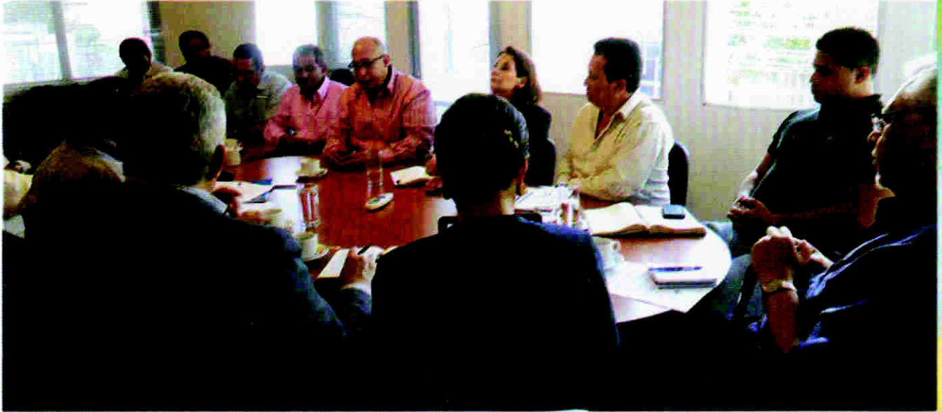
Reunión con miembros de las empresas de seguridad privada del país.

La CRSP compartió los borradores de propuestas de reforma con representantes de diferentes organizaciones de sociedad civil y otros grupos interesados.