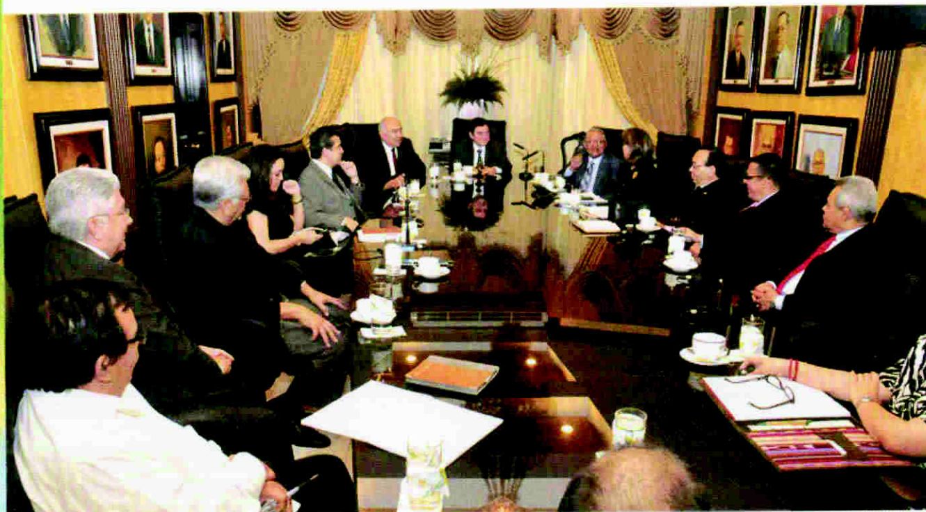
Reunión con el pleno de la Corte Suprema de Justicia con el propósito de conocer los diagnósticos y valoraciones sobre el proceso de reforma de la seguridad pública.