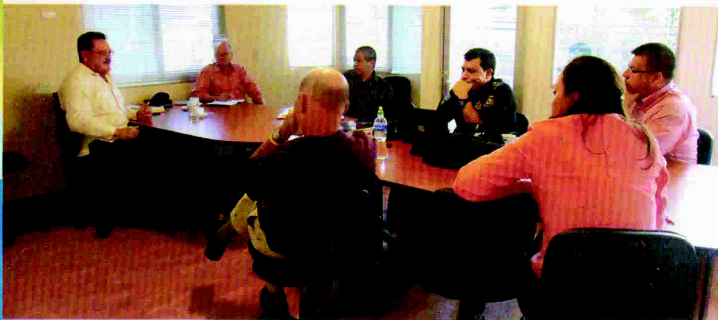
Reunión con oficiales de la policía y asesores del Ministerio de Seguridad.